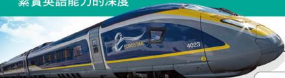
高速列車大比拚 Trains Like Lightning